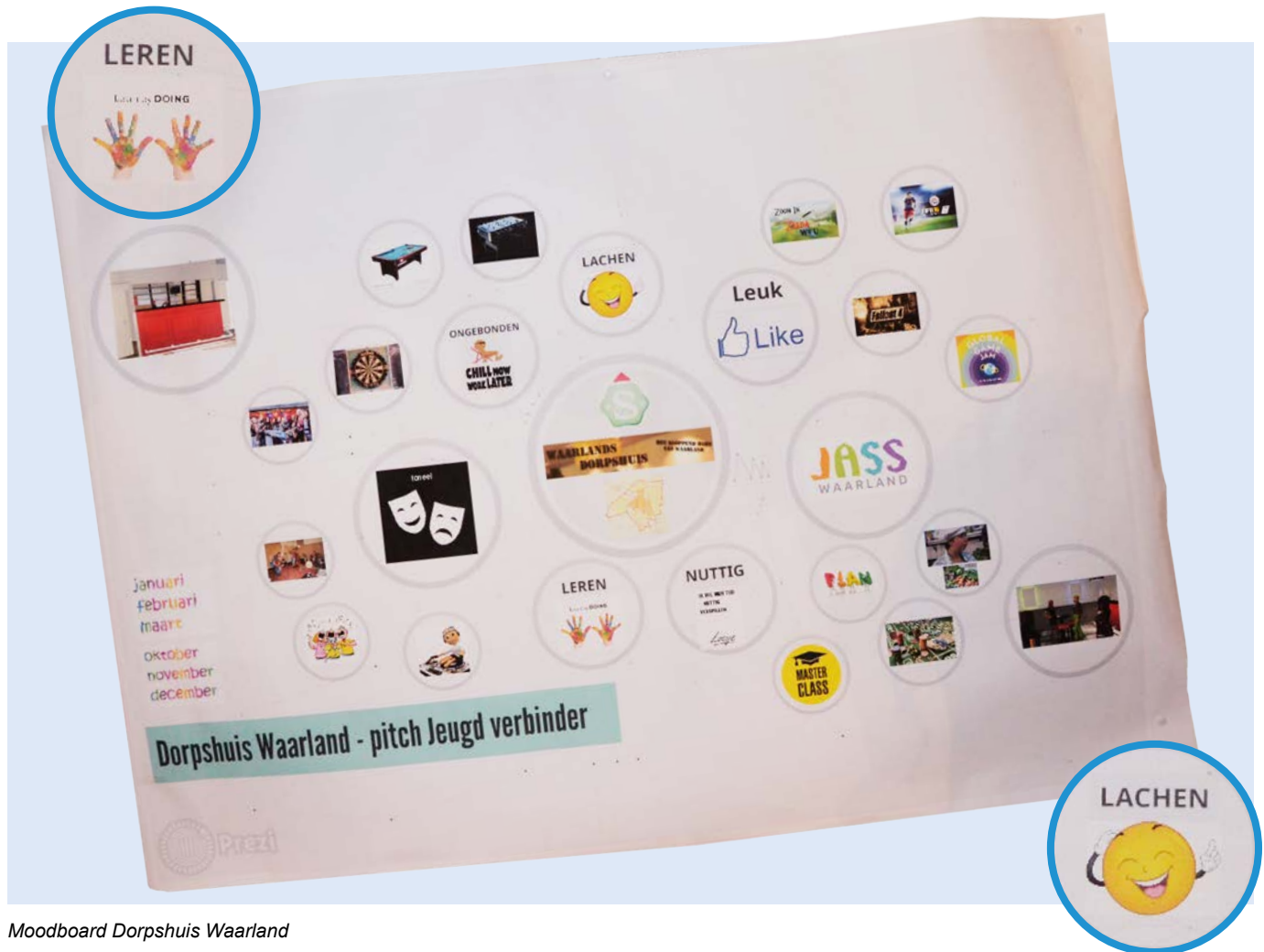
Moodboard Dorpshuis Waarland

Na de lokale bijeenkomst kregen de dorpshuizen de mogelijkheid om samen met een expert hun wensbeeld op een creatieve manier verder uit te werken. Met dit wensbeeld kregen de dorpshuizen de mogelijkheid om in aanmerking te komen voor de pilot en dus op deze manier een wens werkelijkheid te kunnen maken. Alle dorpshuizen zijn in ieder geval gestimuleerd om na te denken over de mogelijkheden die de Wmo hen te bieden heeft en daarnaast hoe je kunt starten met een project.