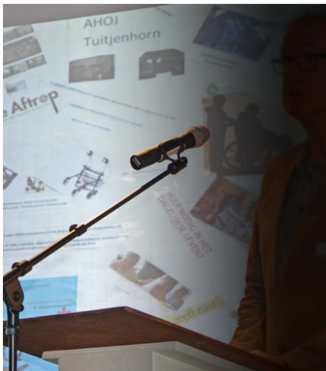
Regionale bijeenkomst Broekerveiling