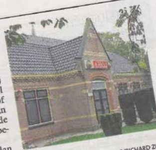
Dorpshuis Ahoj.

Dorpshuis, Centrum (Stroet) en 't Trefpunt (Krabbendam). Samen met de inwoners willen zij ideeën krijgen over een sterkere rol van het dorpshuis. Wie ideeën of suggesties heeft voor dit project kan die spontaan in een van genoemde dorpshuizen vertellen aan de bestuursleden en vrijwilligers. En gebeurt dat vóór 11 maart, dan kunnen die suggesties nog worden meegenomen in dit project.