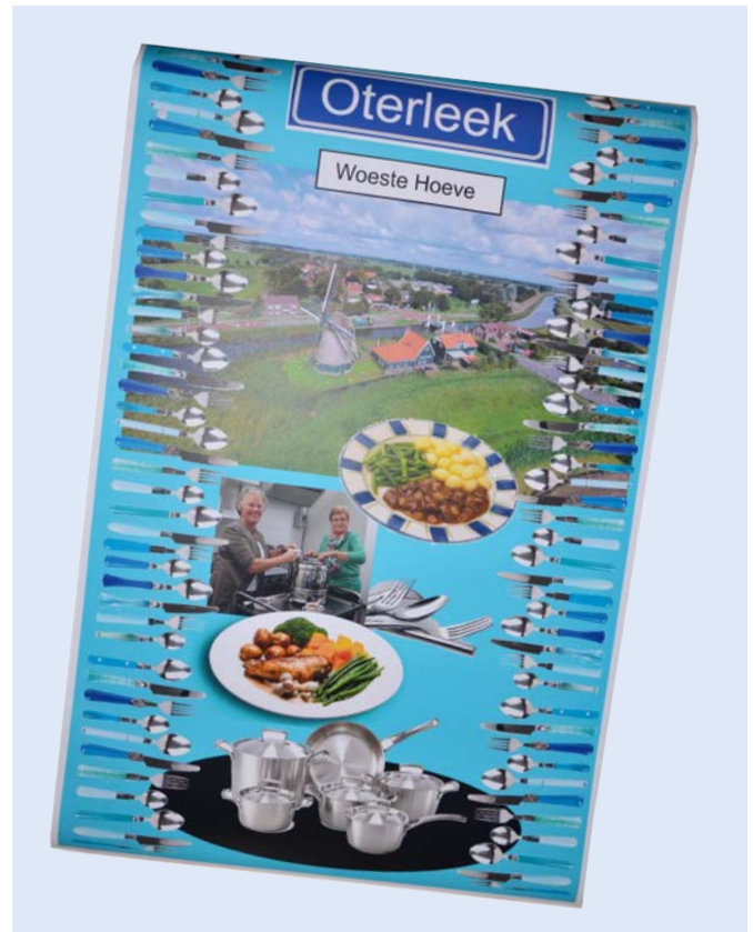
Moodboard Woeste Hoeve - Oterleek

activiteit, dat ze zelf met ideeën gaan komen voor thema's, nevenactiviteiten, aankleding e.d. en dat ze bovendien de organisatie ervan ook zelf ter hand gaan nemen. Uiteraard hebben ze bij deze pilot niet alleen daarop gekoerst, maar is er ook onderzocht of het idee breed gedragen wordt. Daarnaast is er actief gevraagd naar ideeën en zijn dorpsbewoners enthousiast gemaakt. Voor de communicatiestrategie en hoe nu de juiste mensen te bereiken is ondersteuning verleend door een externe deskundige en daarnaast is er geïnvesteerd in een nieuwe website.