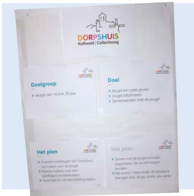
Moodboard Dorpshuis Kolfweid - Callantssoog