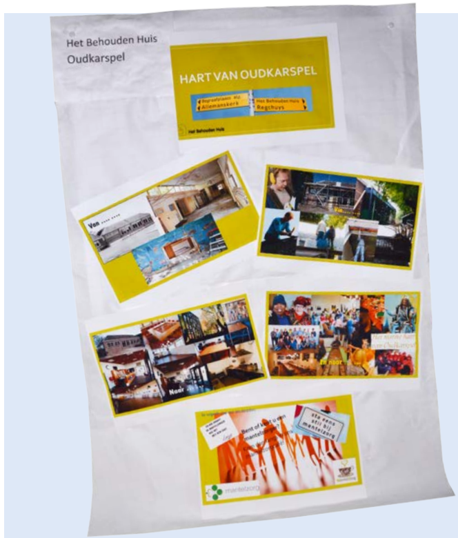
Moodboard Het Behouden Huis - Oudkarspel

Het Behouden Huis is gestart met het leggen van contacten met organisaties die iets doen met mantelzorg. Vervolgens hebben zij in samenwerking een bijeenkomst georganiseerd om te inventariseren wat de behoeften zijn. Hiervoor heeft het Behouden Huis ondersteuning gekregen door een externe deskundige. Wat moet het doel zijn van een mantelzorgbijeenkomst, wanneer wordt een bijeenkomst als succesvol ervaren.